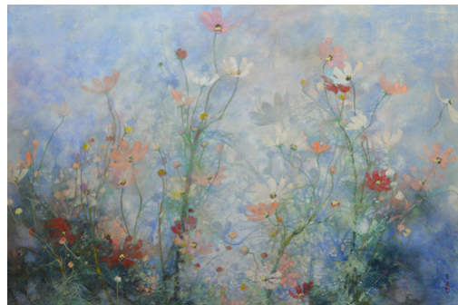
Chen Yiching, Fête , papier japonais maroufflé sur bois, pigments minéraux, 2012 Voir en grand

Mais elle a bien gardé en tête le conseil de son maître : toujours bien connaître les choses avant de les peindre.