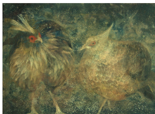
Chen Yiching, Fraternité, papier japonais maroufflé sur bois, pigments minéraux et feuilles d'argent, 2005 Voir en grand

Son attention est attirée par deux poules enfermées dans la même cage. A force de les observer, elle remarque que les deux volailles ne semblent pas trop s'apprécier ! Amusée, elle choisit de les peindre.