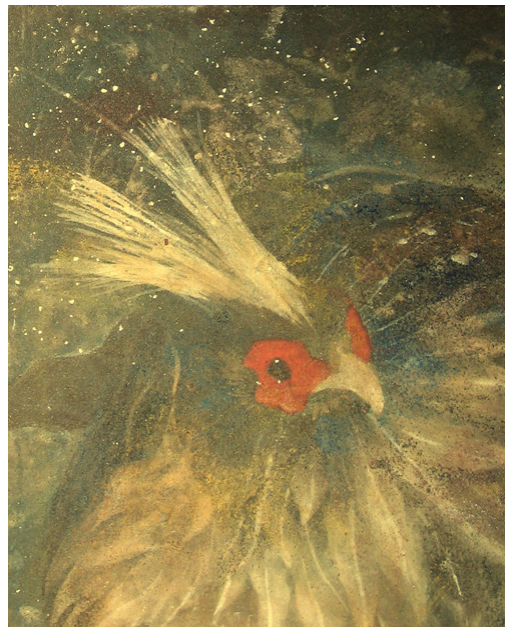
Détail de l'œuvre

En réalisant le portrait de ces deux poules, Yiching peut apprendre à maîtriser toutes les richesses de cette technique exigeante.